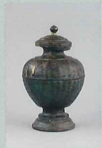
忍性骨蔵器 嘉元元年(1303) 神奈川・極楽寺 重文 真言律宗の忍性の墓(五輪塔)の願主はいわき所生の「禅意」と刻む