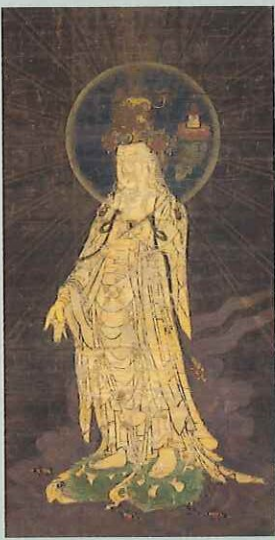
弥勒菩薩像 鎌倉時代 福島・薬王寺 重文 薬王寺に伝来した弥勒菩薩の仏画で称名寺本尊と同図像となる