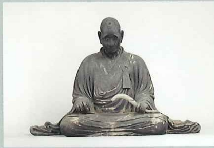
叡尊坐像 室町時代 福島・長福寺 最も東に伝来した鎌倉時代に活躍した西大寺・叡尊の肖像彫刻