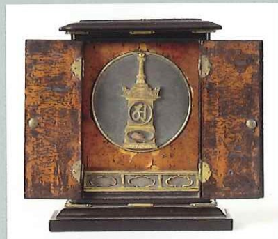
厨子入金銅宝篋印舍利塔 鎌倉時代 福島・薬王寺 重文 真言律宗の関与の可能性もある東国に伝来した珍しい舍利厨子の名品