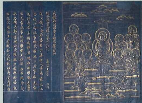
紺紙金字大般若経(伝中尊寺秀衡経) 平安時代 福島・薬王寺 初公開の薬王寺の紺紙金字経二巻のうち伝中尊寺経