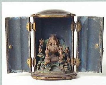
厨子入薬師三尊・十二神将像 鎌倉時代 福島・薬王寺 運慶作の大倉薬師堂の諸像を模刻した極小像で鎌倉時代の蒔絵厨子を伴う