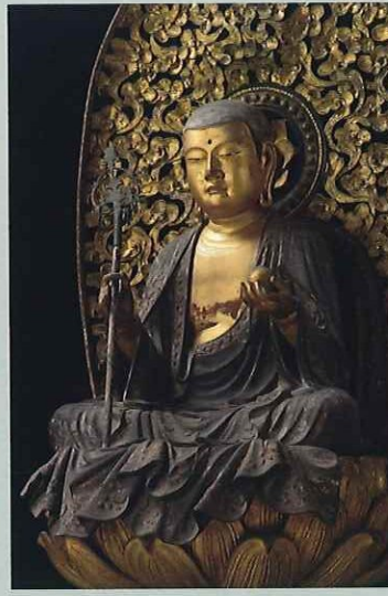
地藏菩薩坐像 院誉作 元亨4年(1324) 福島・長福寺 重文 いわき地方に展開した真言律宗の古刹・長福寺の秘仏本尊