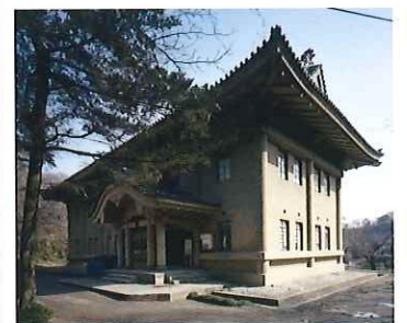
神奈川県立金沢文庫旧館(昭和5年竣工)