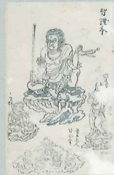
宝寿抄(図像部分) 鎌倉時代 神奈川・称名寺 国宝 鎌倉時代に薬王寺で成立し、称名寺で書写された密教書