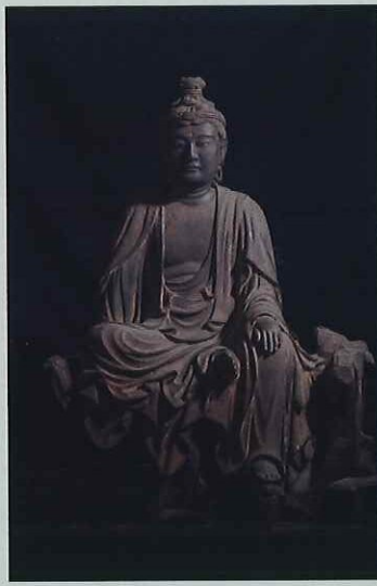
十一面観音菩薩坐像 院誉作 正慶元年(1332) 神奈川・慶珊寺 長福寺地藏菩薩像と同じ院誉作で鎌倉・金沢に伝来した幡間八幡宮ゆかりの像