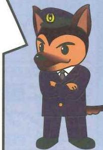
少年育成課マスコット ジャンパード警部

一緒にプレイをしたりゲームで知り合った人とチャットをしたりしていると、仲間意識が芽生えてくるかもしれません。その仲間意識や信頼感を悪用してあなたを闇バイトの世界に引きずり込もうとする人や、性的な画像を送らせようとする人、わいせつな行為をしようとする人がいます。安易に個人情報を渡さない・アルバイト案件に興味を示さない、会いに行かないことが大切です。