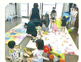
あかちゃんとあそぼう