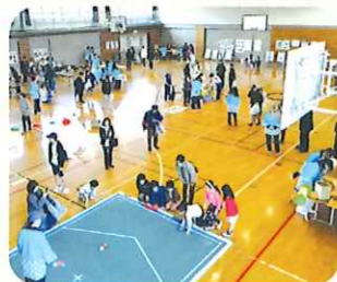
葉っぱいフェスタ