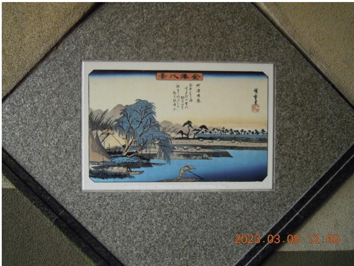
版画 歌川広重 金沢八景 陶板 2 称名の晩鐘