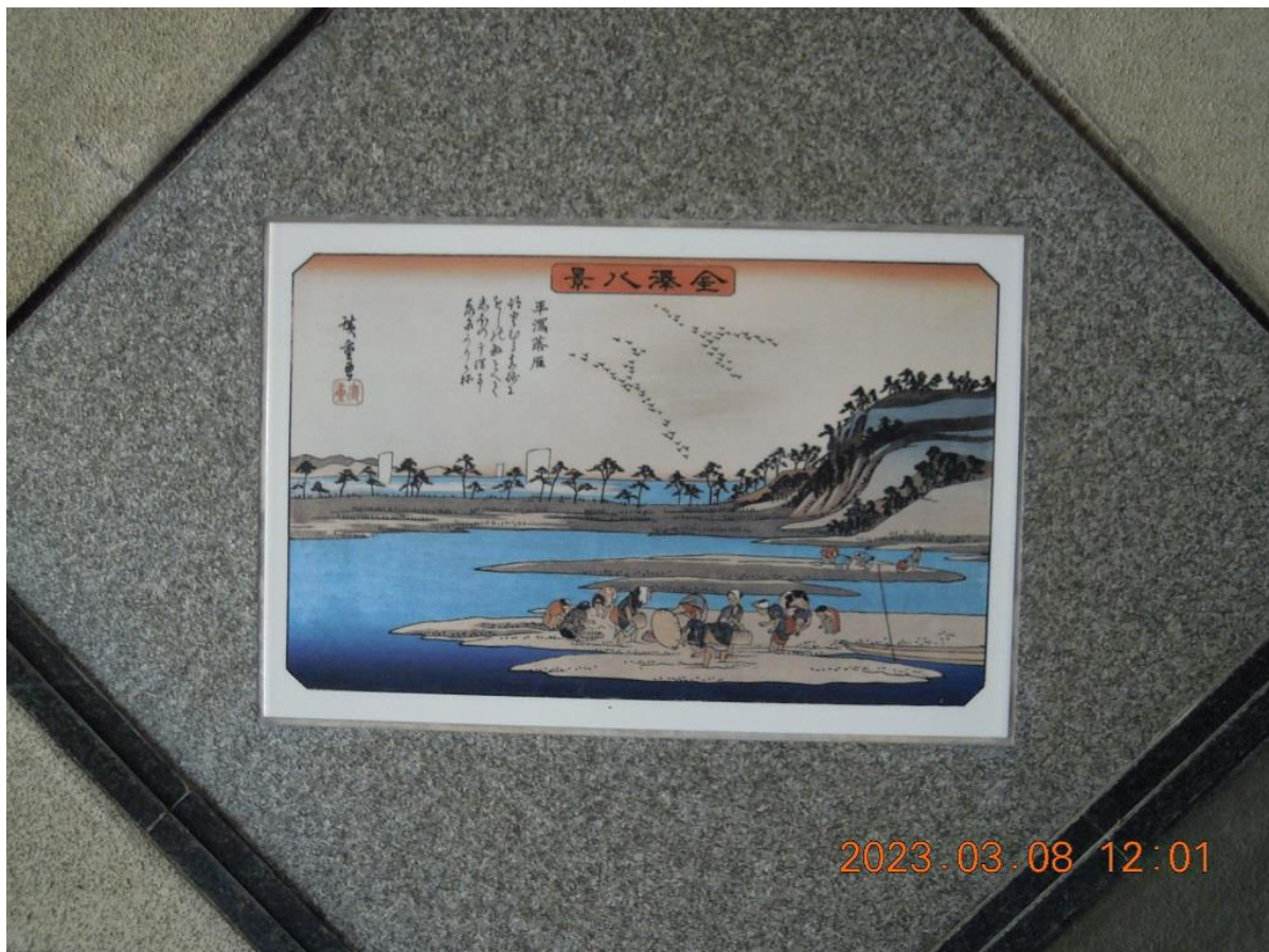
版画 歌川広重 金沢八景 陶板 6 乙舳の帰帆