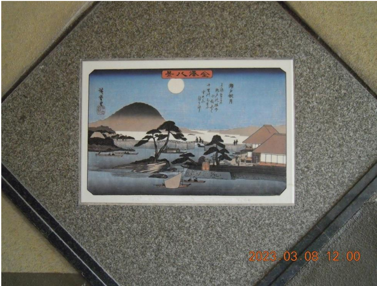
版画 歌川広重 金沢八景 陶板 8 小泉の夜雨