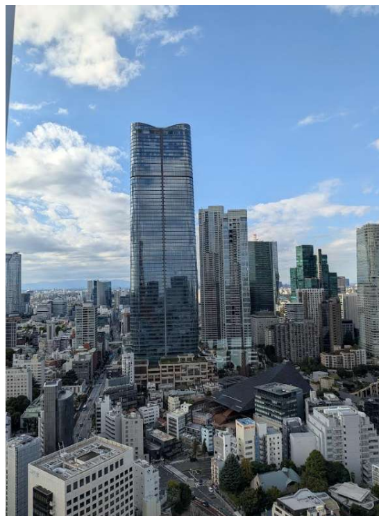
(東京タワーメインデッキより)

次は柴又です。 ここでは「寅さんミュージアム」、 「柴又帝釈天」、参道散策を楽しみ、 草団子を土産に帰路につきました。